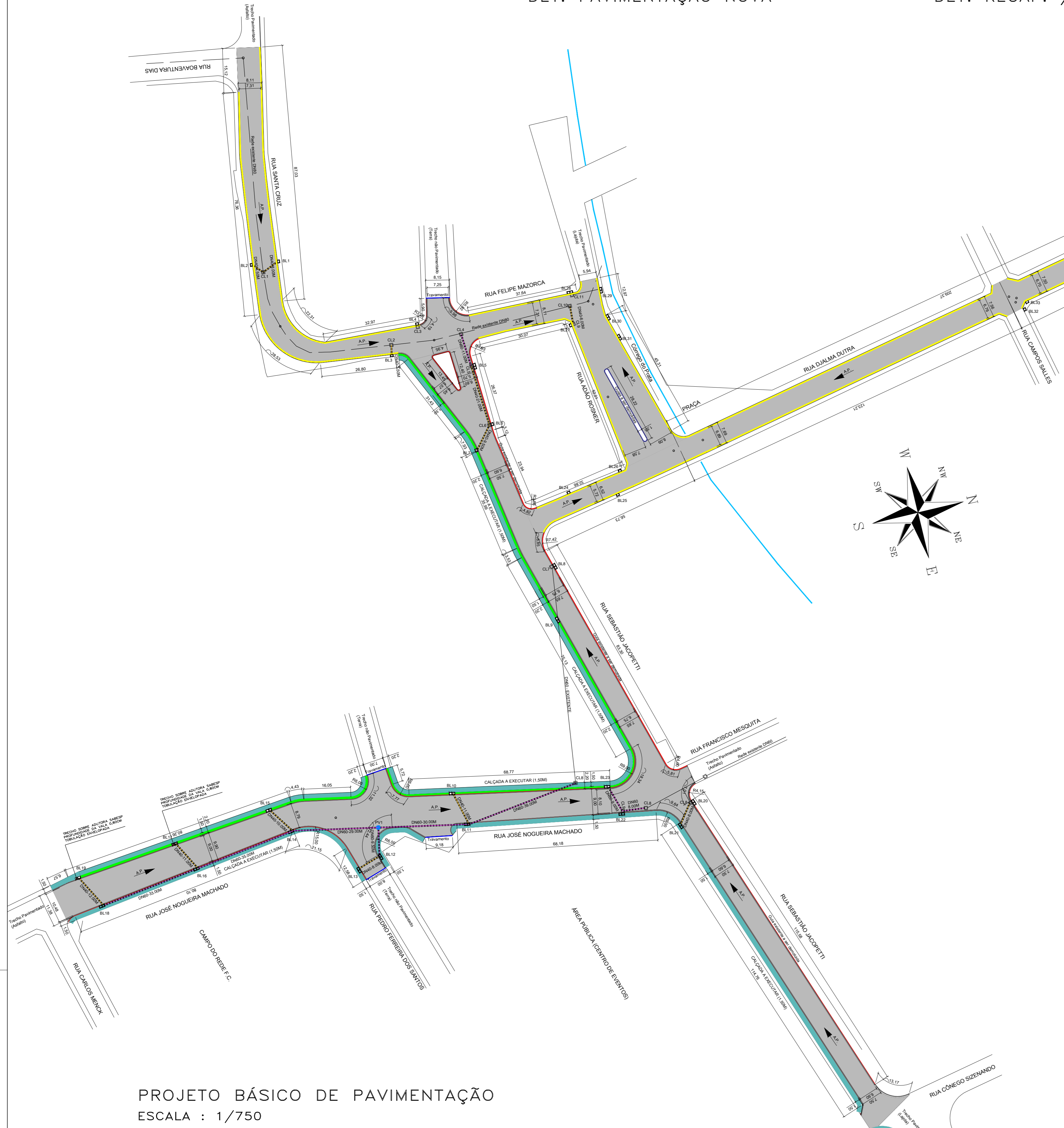
DET. DEMOLIÇÃO LAJOTA/PAVIMENTO