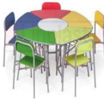
Ref. Item 14