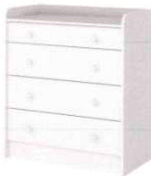
Ref. Item 12