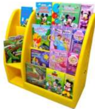
Ref. Item 17