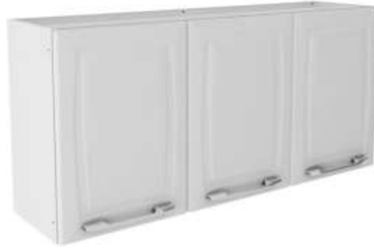
Ref. Item 07